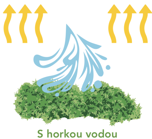
S horkou vodou